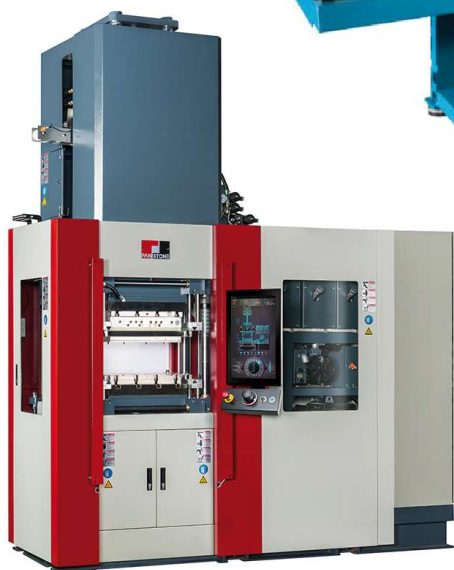
Pan Stone injektions- press för gummi