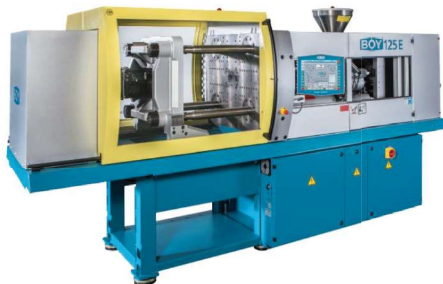
Boy 125E formsprut- maskin